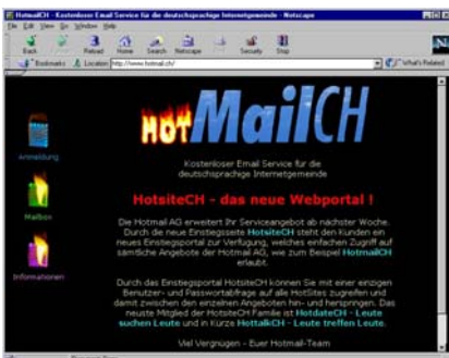
Verletzung von Markenrechten (OG Basel-Landschaft, 2.5.2000)