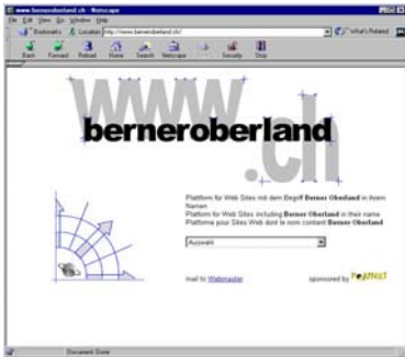
Bösgläubige Registrierung, Irreführung bzw. Verwechslung (BGE 126 III 239)